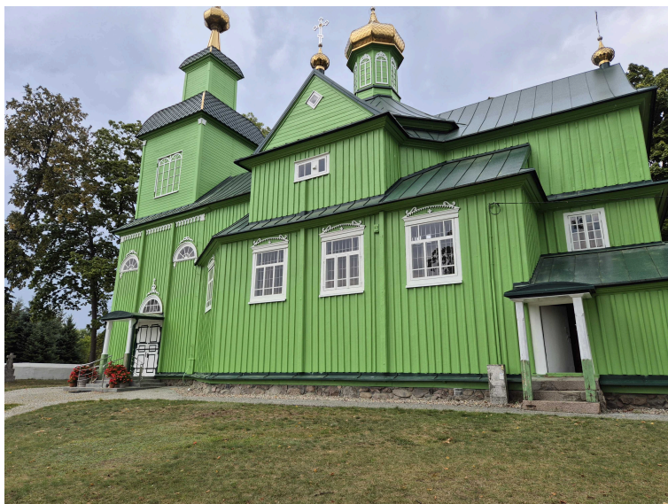
© Ben-Bud Krzysztof Chrościelewski Ben-Bud Krzysztof Chrościelewski