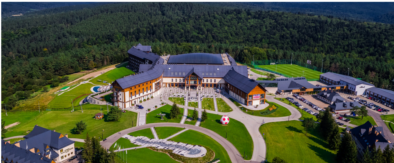
© Hotel Arłamów / Remmers Polska Hotel Arłamów / Remmers Polska